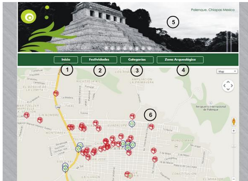
Figura 4. Interfaz mapa turístico de la región de Palenque.