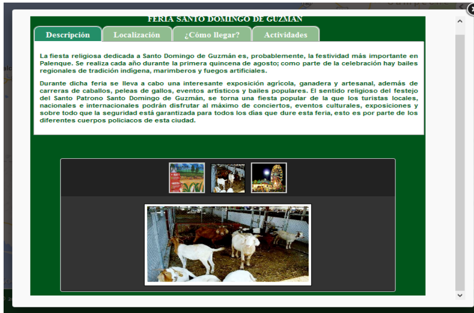
Figura 2. Ficha informativa del átomo turístico temporal “Feria Santo Domingo de Guzman”.

Los átomos son “democráticos” no consideran si el sitio es conocido a nivel nacional o internacional, si es playa o paraje natural entre otros a los que generalmente toda la gente los reconoce como sitios turísticos y se les da difusión