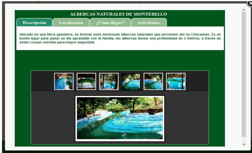
Figura 1. Ficha informativa del átomo turístico permanente “Albercas Naturales de Monte Bello”.